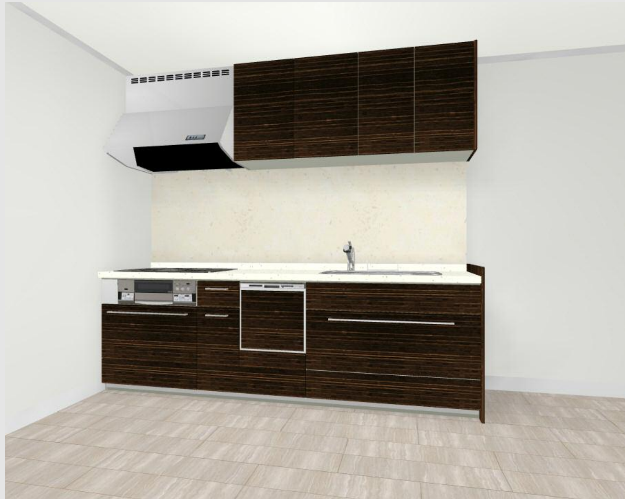
CG合成によるイメージ画像です。 現場調達品、シリーズ外選定品に関しては表現しておりません。