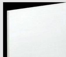
□ LW2 クリエホワイト