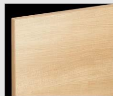
□ LP2 クリエベール