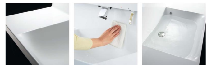
滑らかなカウンターからビルトイン水栓で、ハイバックガードのお手入れしやすさがアップ。ゆったりとしたカーブのボウル。