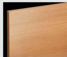
□ LL2 クリエラスク