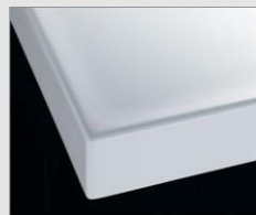
□ H プレーン材ホワイト