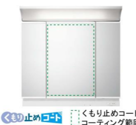
くもり止めコート くもり止めコートコーティング範囲 3面鏡(全収納・蛍光灯照明) MLCWE1-903TXU