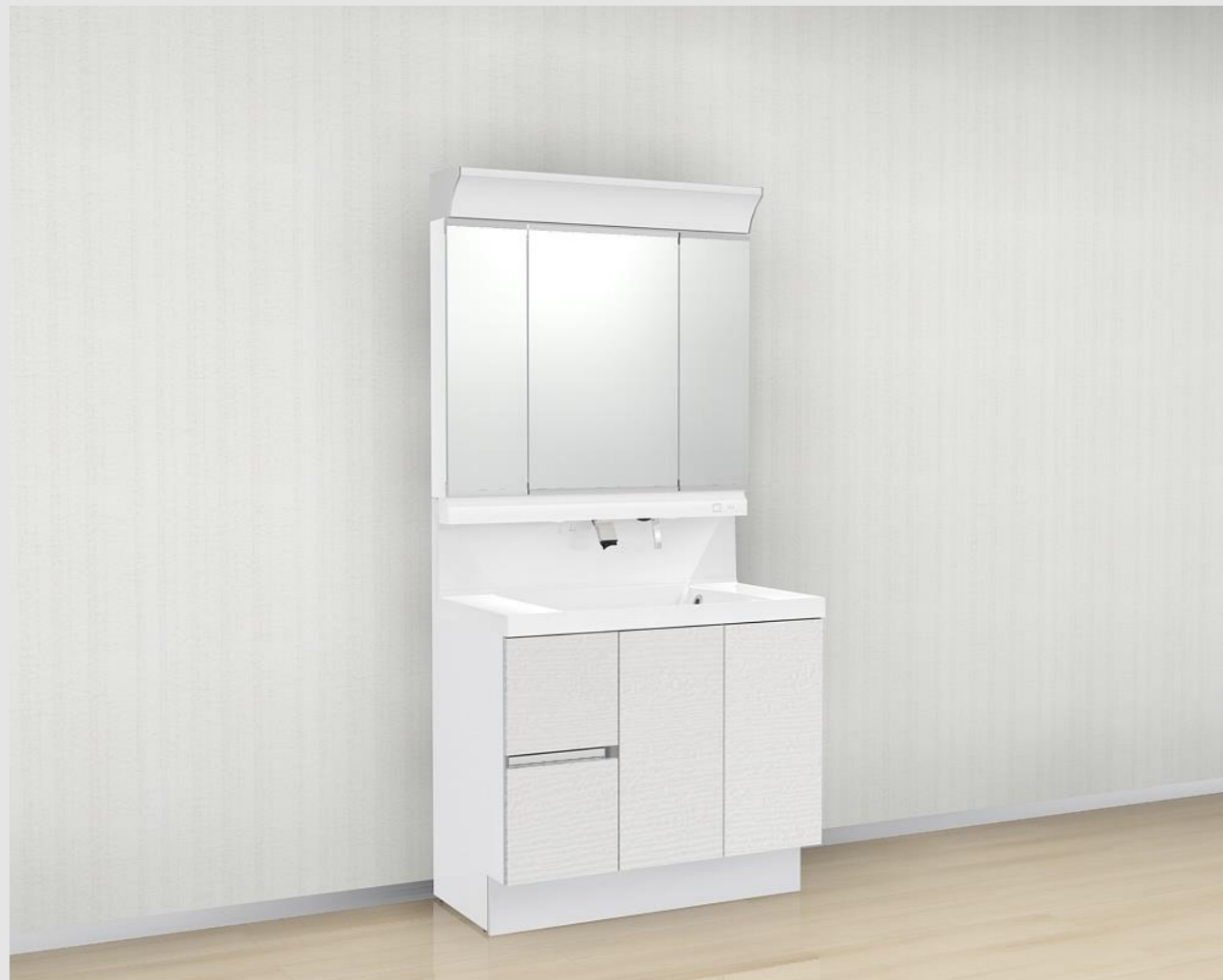
CG合成によるイメージ画像です。