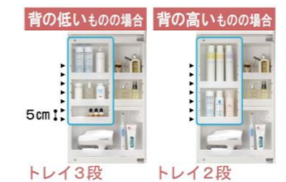
トレイ3段 トレイ2段