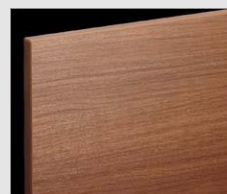
□ LM2 クリエモカ