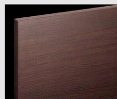
□ LD2 クリエターナ